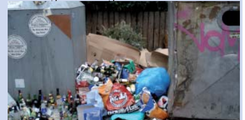
Deponiestelle Aachen, D

durchwühlen den Müll, um sich ihr tägliches Überleben zu sichern. In Buenos Aires sind sie die Recycler. Buenos Aires sieht sauber und propper aus, jedoch nur